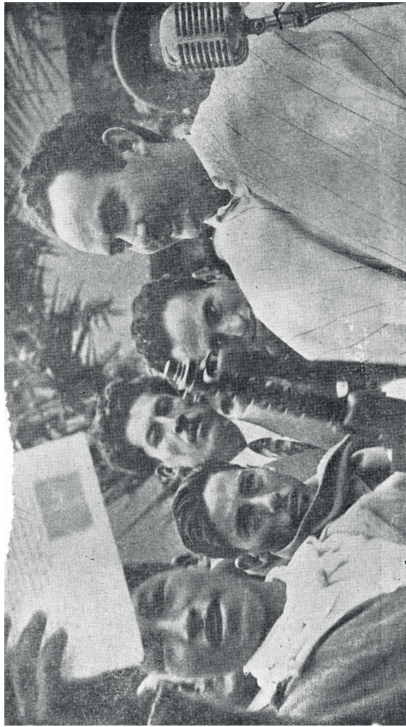
ÑUFLO CHÁVEZ ENTREGA UN TÍTULO Y UN ARMA: 1953: El decreto de Reforma Agraria entrega la tierra al que la trabaja. Chávez pone en manos del campesino un arma para defenderla