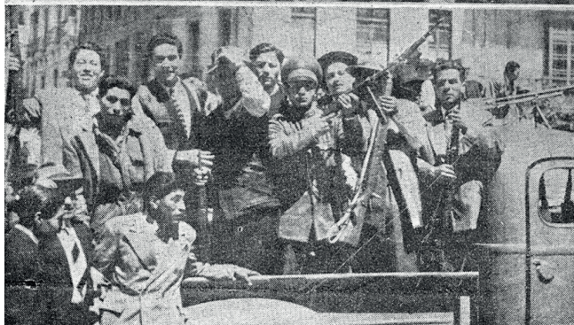
UN PUEBLO LUCHA POR SU LIBERTAD, 9 DE ABRIL DE 1952.- Ese día un golpe de Estado se transforma en una revolución popular